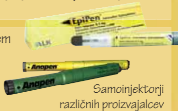
Samoinjektorji različnih proizvajalcev

Edino zdravilo, ki lahko ustavi razvoj anafilaktične reakcije, če je dano v pravilnem odmerku in ob pravem času, je adrenalin. Zato je ključna točka priporočil prav predpis adrenalinskega avtoinjektorja (EpiPen, Anapen). Hkrati z adrenalinom mora bolnik dobiti tudi natančna navodila o tem, kdaj in kako naj uporabi samoinjektor.