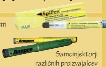
Samoinjektorji različnih proizvajalcev

Edino zdravilo, ki lahko ustavi razvoj anafilaktične reakcije, če je dano v pravilnem odmerku in ob pravem času, je adrenalin. Zato je ključna točka priporočil prav predpis adrenalinskega avtoinjektorja (EpiPen, Anapen). Hkrati z adrenalinom mora bolnik dobiti tudi natančna navodila o tem, kdaj in kako naj uporabi samoinjektor.