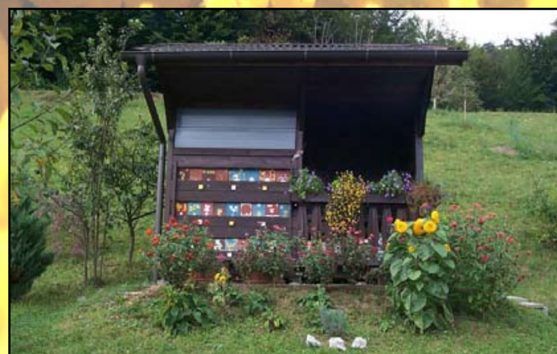
Tam, kjer primanjkuje gnezdilnih mest, jim lahko pomagamo tako, da jih gojimo v čmrlnjakih.

Izid plakata je financiran s sredstvi Programa svetovalne službe v čebelarstvu.