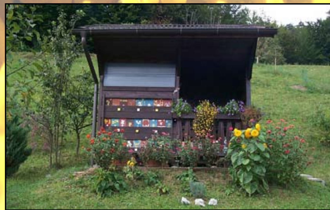
Tam, kjer primanjkuje gnezdilnih mest, jim lahko pomagamo tako, da jih gojimo v čmrlnjakih.

Izid plakata je financiran s sredstvi Programa svetovalne službe v čebelarstvu.