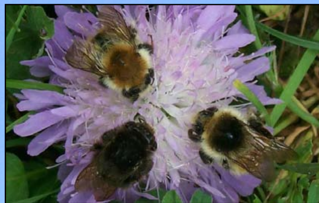
Bombus humilis se pojavlja v treh barvnih različicah. V Sloveniji je najpogostejša črna. Ponekod je že izumrl.