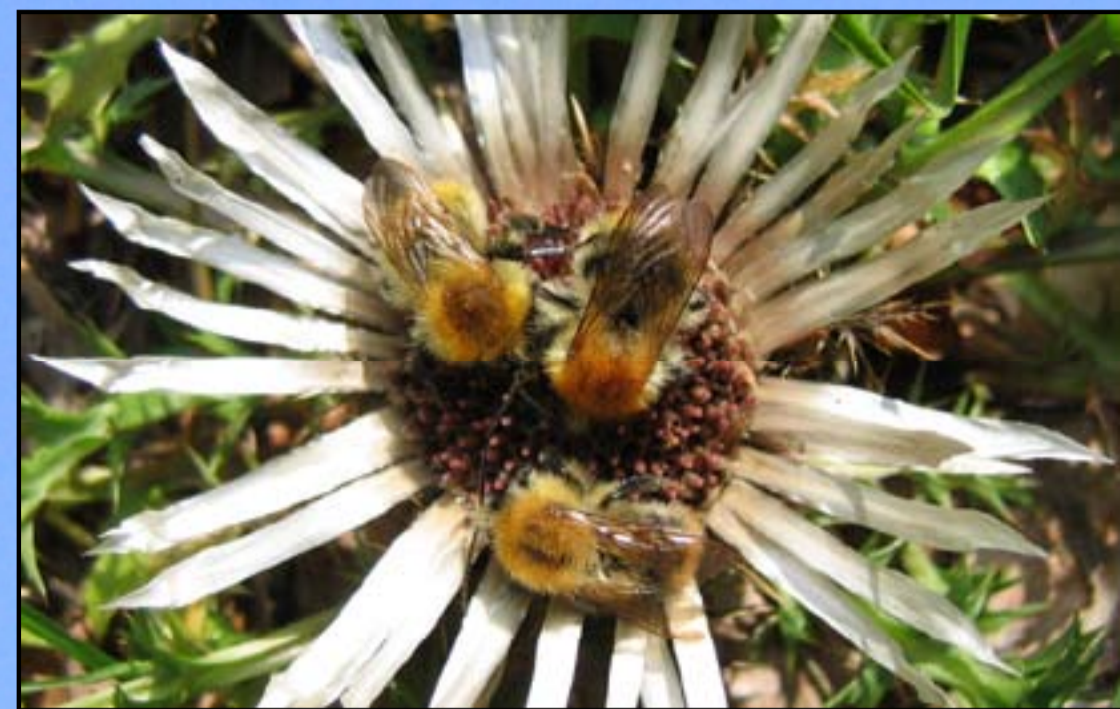
Bombus pascuorum je med našimi najpogostejšimi vrstami. Gnezdi na površini v mahu ali posušeni travi.

V zadnjem času predstavlja grožnjo tudi uvažanje gojenih čmrljev za opraševanje kulturnih rastlin.