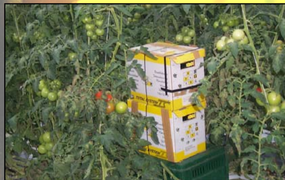
Čmrlji so najboljši opraševalci paradižnika. V rastlinjakih za opraševanje uporabljajo gojene družine.