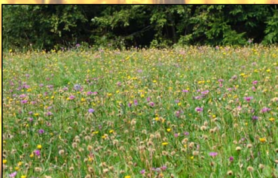
Čmrlji potrebujejo cvetoče pozno košene travnike. Le na njih lahko dobijo dovolj hrane.

Čmrlji so sorodniki čebel. V Sloveniji živi vsaj 30 vrst. Zimo preživijo samo v zadnjem letu izlegle matice, ki pomladi naredijo novo gnezdo in same poskrbijo za prvo generacijo delavk. V gnezdu živi nekaj deset do nekaj sto delavk.