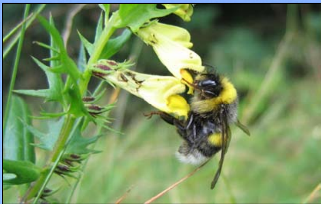
Bombus lucorum gnezdi pod zemljo. Družine so zelo številčne in imajo več sto osebkov.