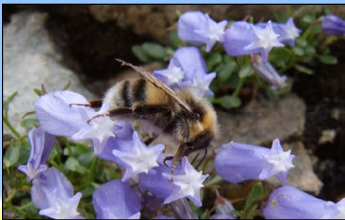
Čmrlji letajo tudi v mrazu in dežju, ko je večina opraševalcev nedejavnih. Najdemo jih tudi v gorah.