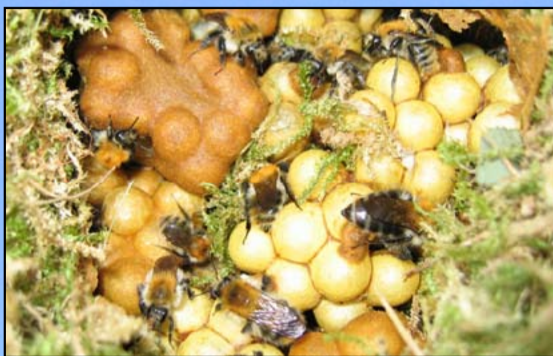
Čmrlji imajo gnezdo pod zemljo v rovih gladavcev ali na površini v mahu. V družini so matica, delavke in samčki.

So pomembni opraševalci divjih in kulturnih rastlin. Zaradi intenzivnega kmetijstva so mnoge vrste ogrožene.