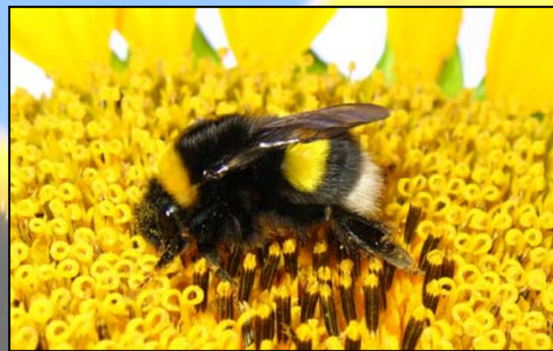
Ker so zelo odlašeni so dobri prenašalci cvetnega prahu. "Kožušček" jih sicer ščiti pred mrazom.