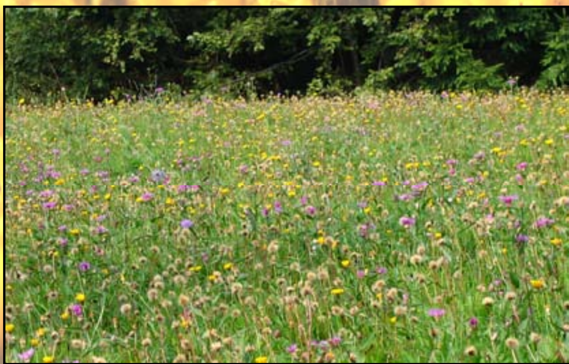
Čmrlji potrebujejo cvetoče pozno košene travnike. Le na njih lahko dobijo dovolj hrane.

Čmrlji so sorodniki čebel. V Sloveniji živi vsaj 30 vrst. Zimo preživijo samo v zadnjem letu izlegle matice, ki pomladi naredijo novo gnezdo in same poskrbijo za prvo generacijo delavk. V gnezdu živi nekaj deset do nekaj sto delavk.