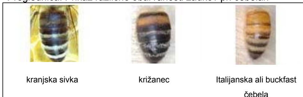
Preglednica: Prikaz različne obarvanosti zadkov pri čebelah

vseh pregledih čebeljih družin med letom pozoren na pojav čebel z rumenimi obročki na zadku. Ob morebitnem pojavu mora čebelar zamenja matico, priporočljivo pa je tudi, da iz panja odstraniti vso trotovino. Novo matico čebelar doda iz lastne vzreje ali jo kupi od bližnjega vzrejevalca.